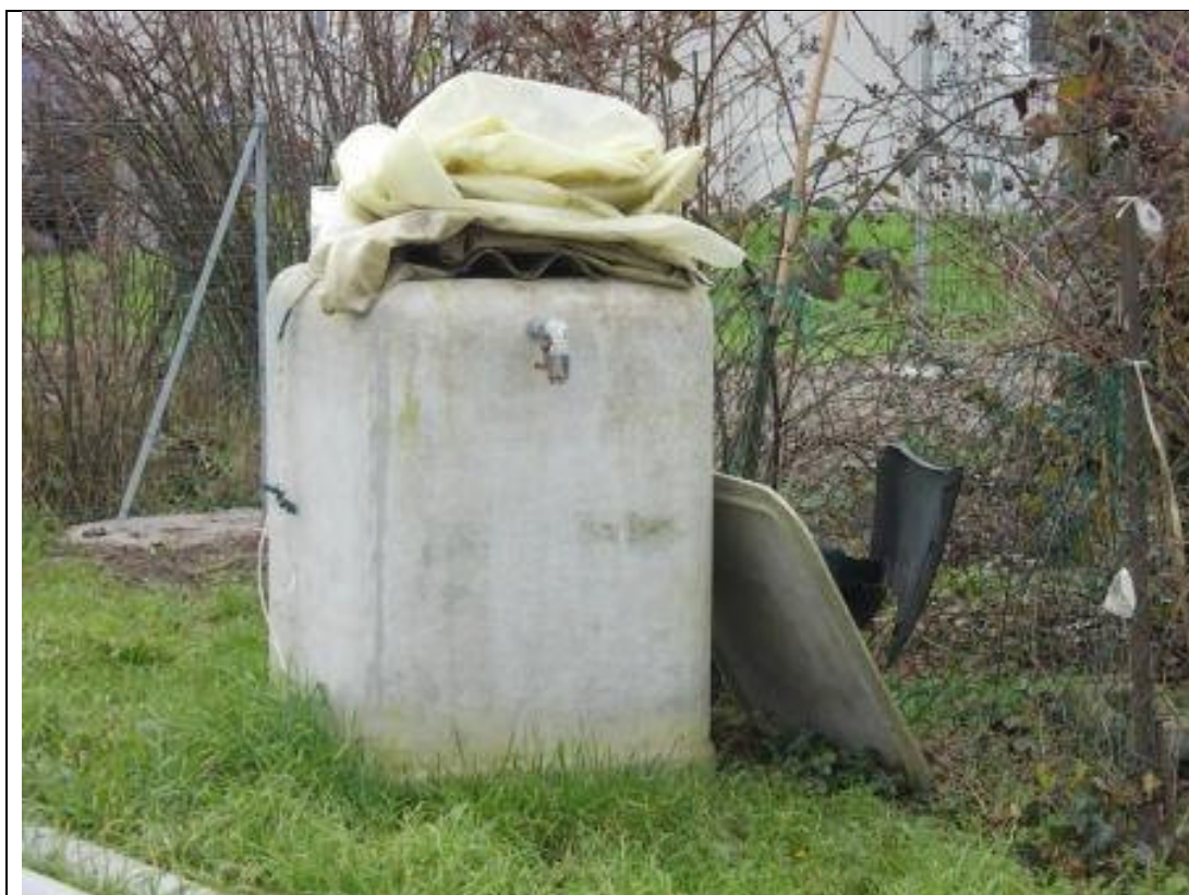
POS CA 9 (1)