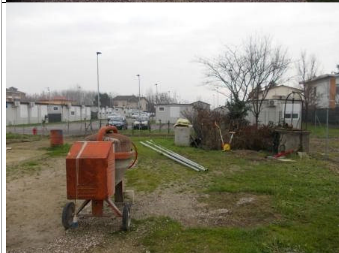
POS CA 9 (4)