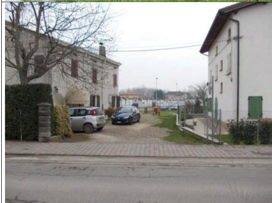
POS CA 9 (2)