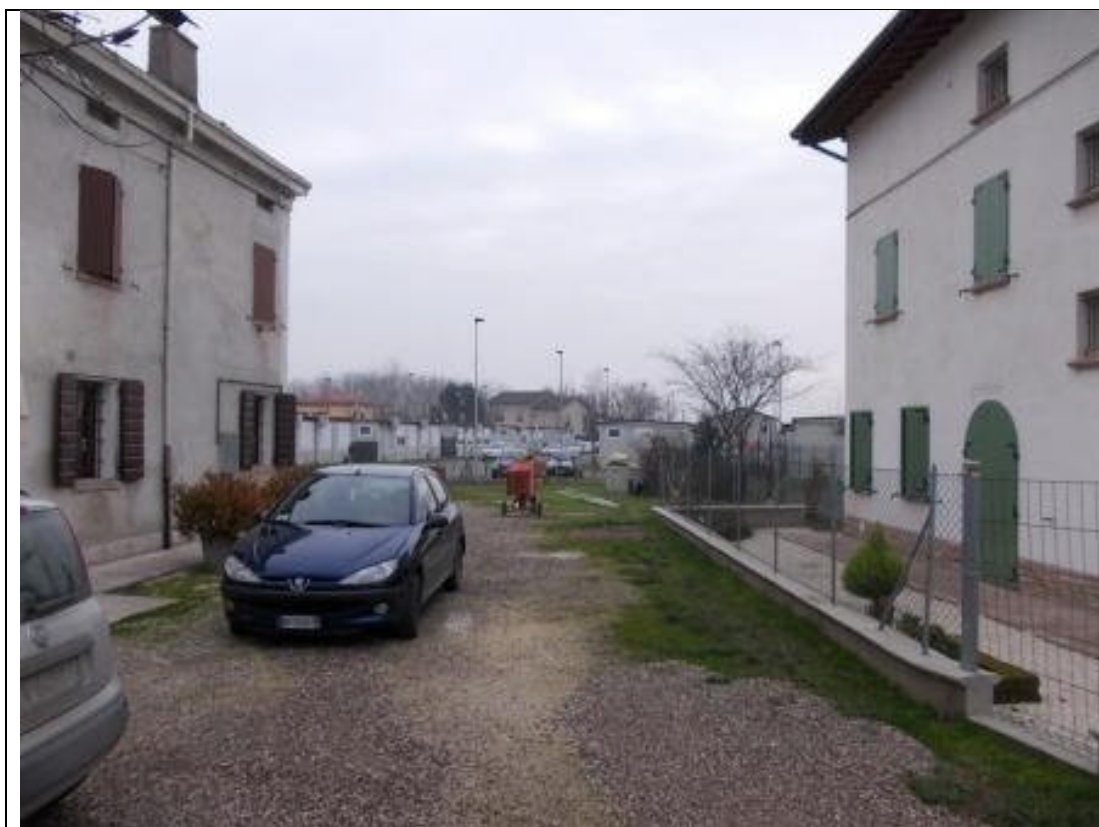
POS CA 9 (3)